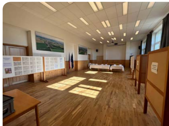
Rekonstrukce malého sálu.