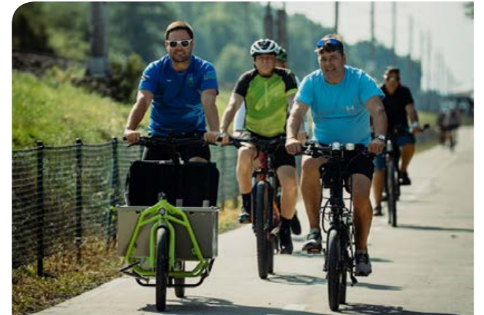
Dokončení cyklostezky Černovír–Štěpánov.