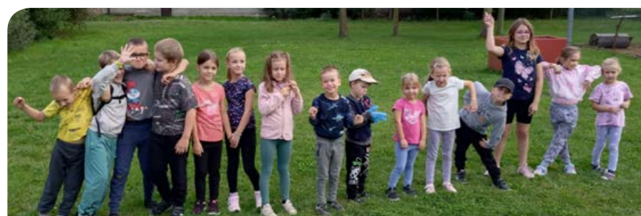
Oddíl mladých hasičů SDH Štarnov - venkovní trénink.