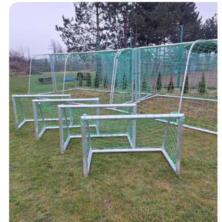
Fotodokumentace aktivit FOTBAL COMPANY z.s..