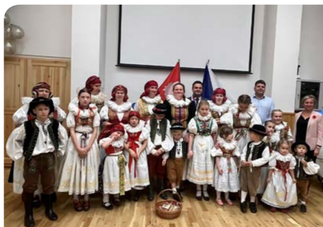
Folklorní soubor Hagnózek.