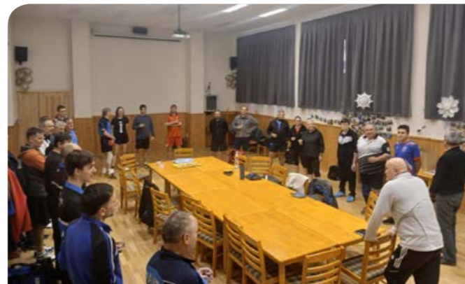
Vánoční turnaj ve stolním tenise.