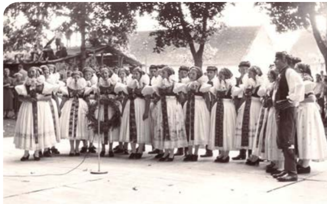
Taneční soubor ze Štarnova.