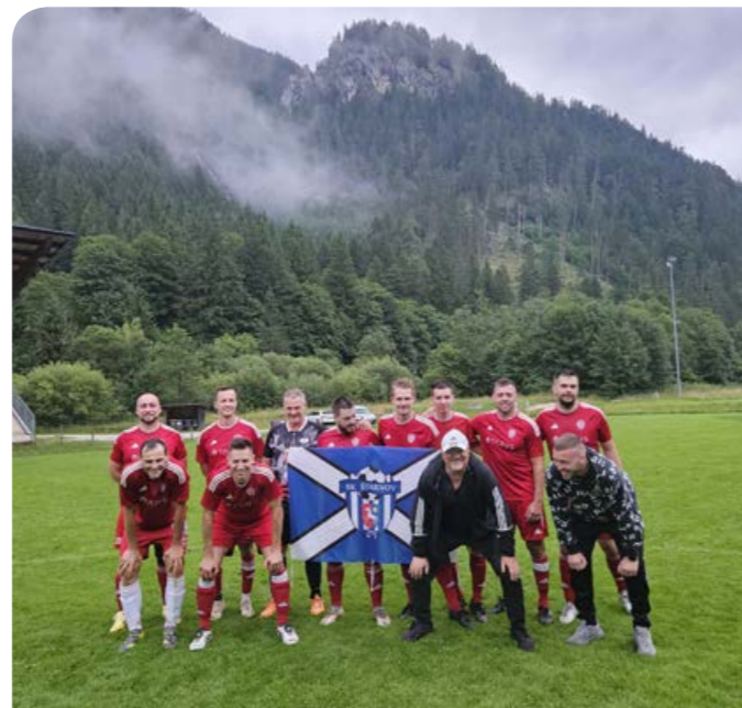
SK Štarnov v Mariazell.