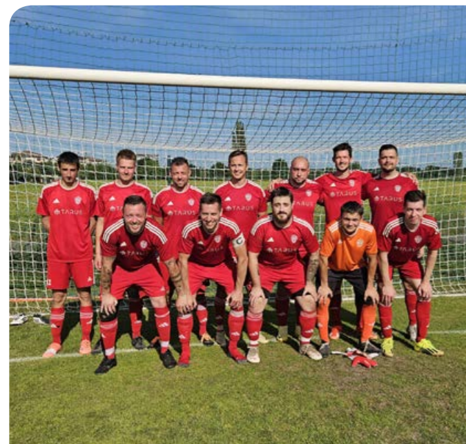
SK Štarnov výhra 2:3 ve Slavoníně.

Toto vedlo k poměrně jasné záchraně s 35 body a hlavně doma poměrně jasná vítězství, např. s do té doby prvními Hodolany 4:1 a nakonec s mistrovským Slavonínem na penaltu 3:2.