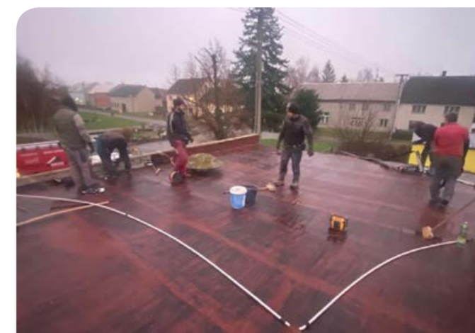
Oprava střechy hasičské zbrojnice před instalací FVE.

V rámci realizace stavby vodojemu bude vybudován také přívodní vodovodní řad o délce cca 1000 m do obce Štarnov