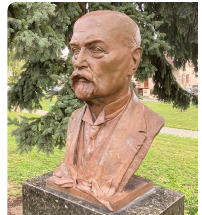
Restaurování památníku T. G. Masaryka.