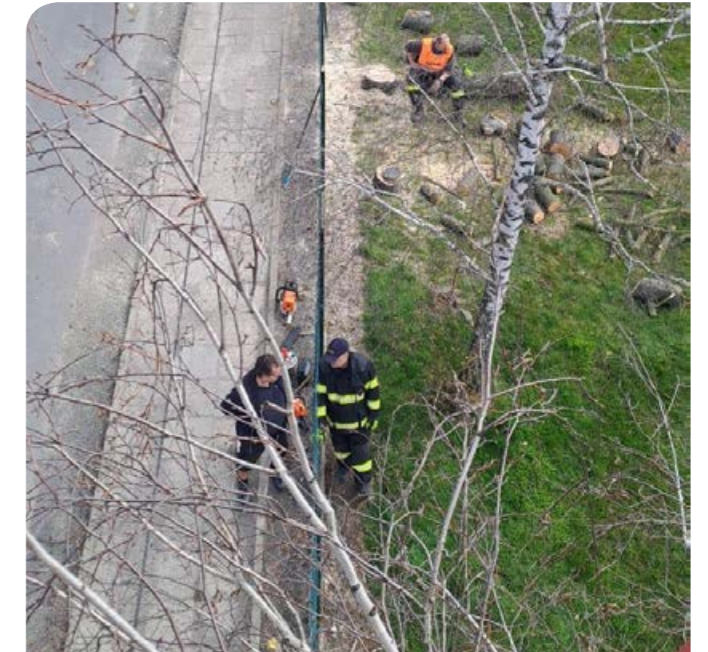
Fotodokumentace aktivit Jednotky SDH Štarnov.