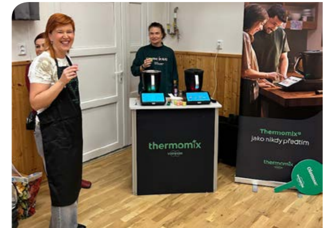
Štarnovský mini food festival.