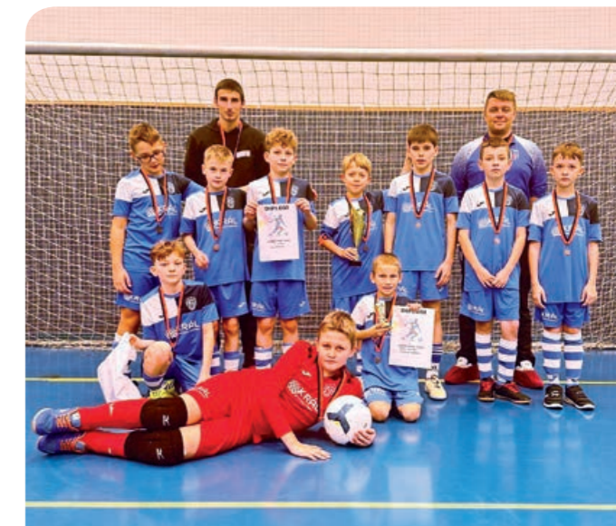
Mládež SK Štarnov.