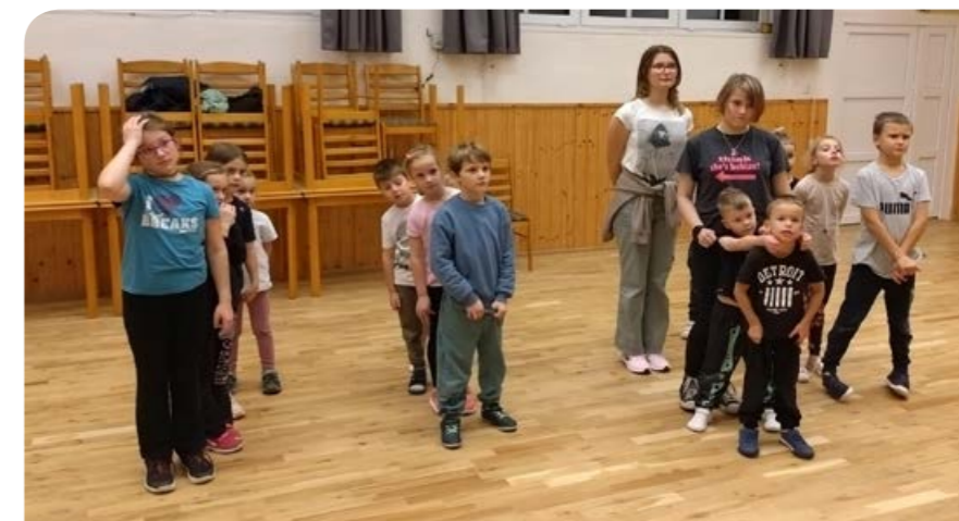
Oddíl mladých hasičů SDH Štarnov.