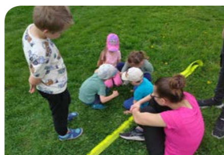
Zachraňujeme zraněnou berušku.