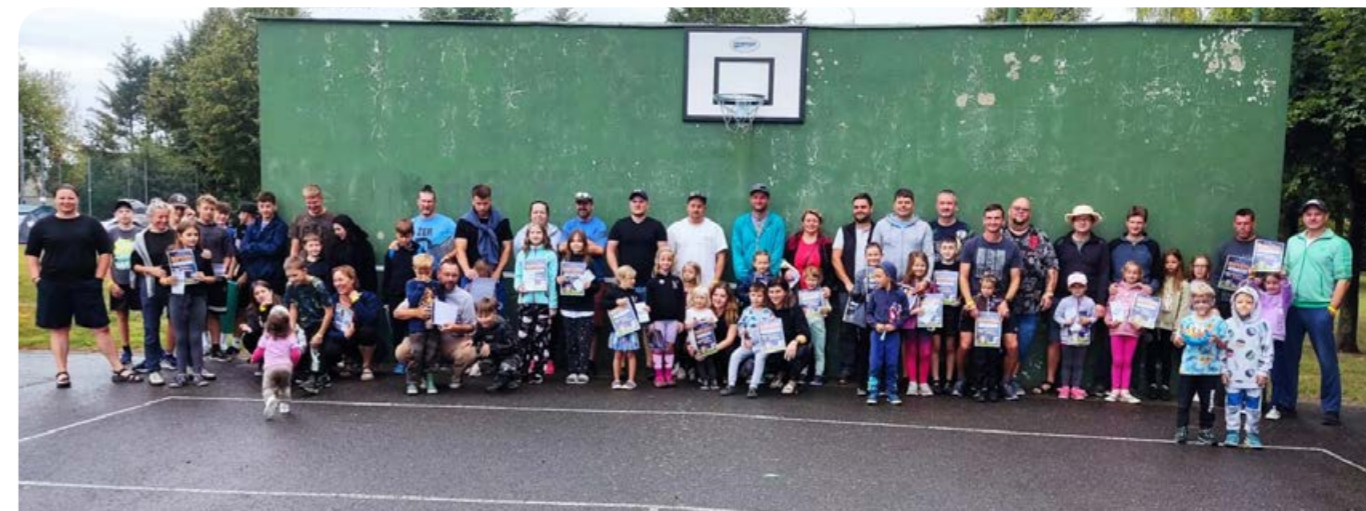
Dostanu někoho do stanu.