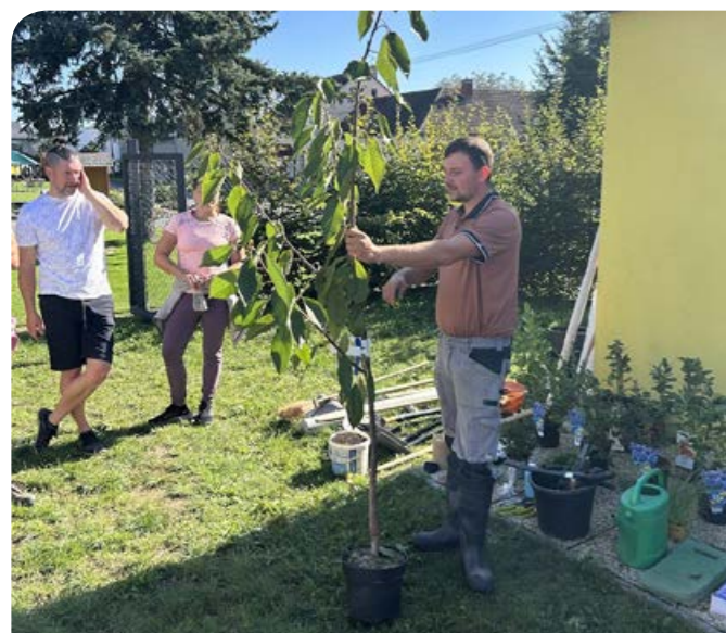
Zahradnický workshop v areálu ZŠ.