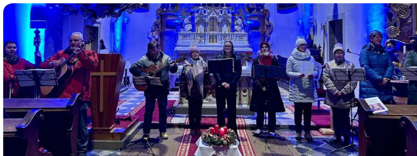
Vánoční koncert MS Band a MS Chór z Velké Bystřice v kostele sv. Mikuláše.