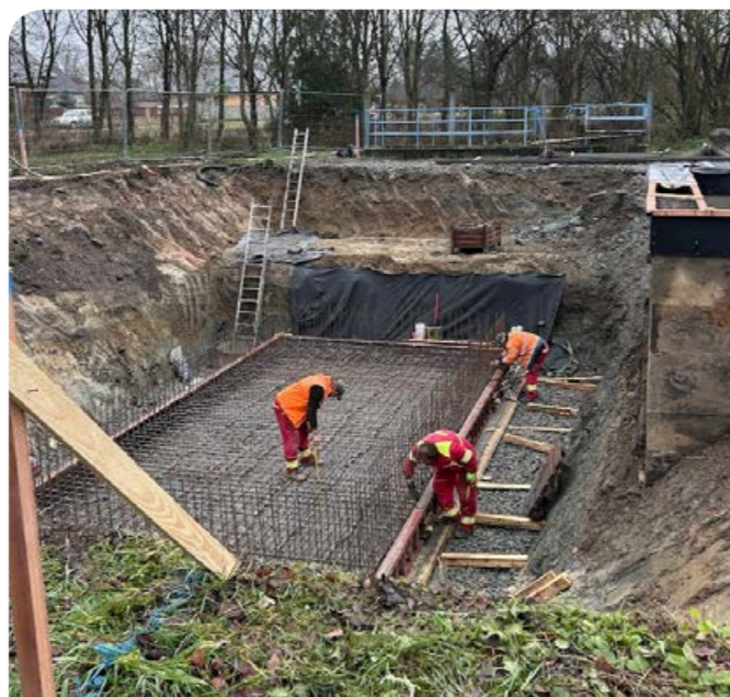
Práce na denitrifikační nádrži.