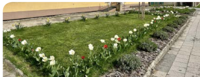
Výsadba záhonů před obecním úřadem.