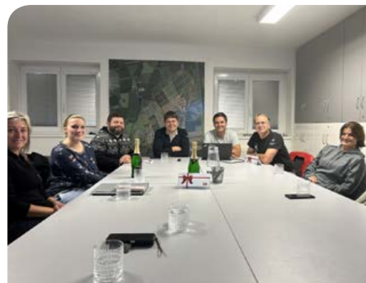
Vyhlášení a ocenění vítězů fotografické soutěže.