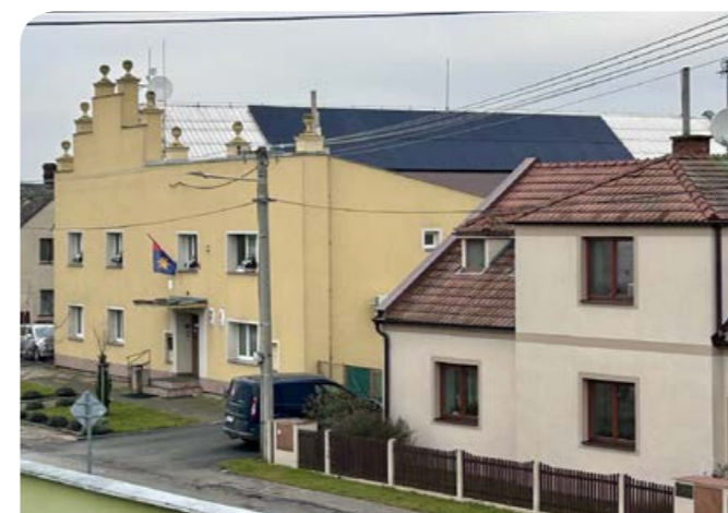
Instalace FVE na budově sokolovny.

Jak již bylo řečeno v úvodníku, obec se letos dotkne ještě jedna investiční akce. V únoru 2026 bude ve Štarnově zahájena stavba nového zemního vodojemu pojmenovaného podle místního názvu lokality, ve které se nachází – Aleš. Bude součástí skupinového vodovodu Štarnov zásobujícího pitnou vodou nejen toto město, ale i řadu obcí v okolí. Vodojem je dvoukomorový s akumulačními nádržemi o objemu 2 x 250 m 3 , tzn. o celkovém objemu 500 000 litrů vody. Jeho součástí jsou přívodní řad a odběrný řad, každý o délce 780 m – jedná se o potrubní napojení vodojemu na vodovodní systém.