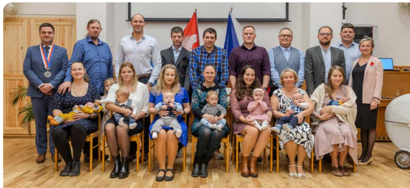
Slavnostní vítání občánek ve Štarnově 2025.